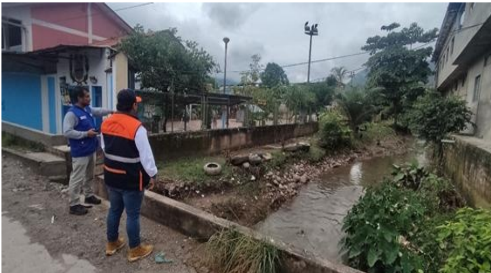
FIGURA N°03: TRAMO INICIAL DONDE SE REALIZARÁ LOS TRABAJOS DE DESCOLMATACIÓN

Ministerio de Desarrollo Agrario y Riego