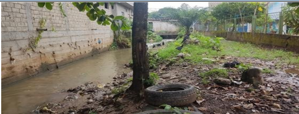
FIGURA N°01: TRAMO DONDE SE REALIZARÁ LOS TRABAJOS DE DESCOLMATACIÓN