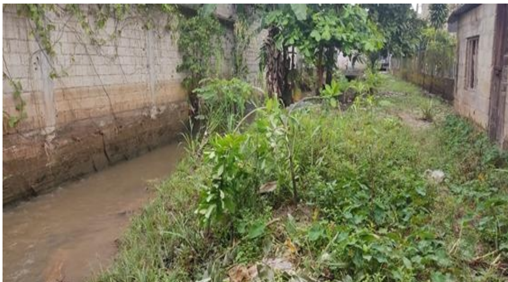
FIGURA N°02: TRAMO DONDE SE REALIZARÁ LOS TRABAJOS DE DESCOLMATACIÓN